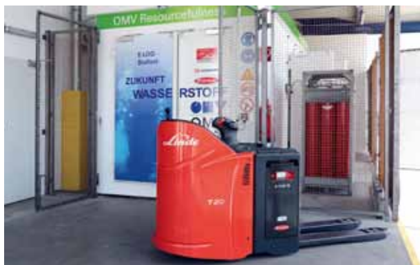
Fahrzeug mit Wasserstoffanlage

Die neuen Fahrzeuge werden seit Juni 2013 im praktischen Industrieumfeld (am Standort DB Schenker in Hörsching) getestet. Im Alltagsbetrieb mit einer anspruchsvollen Logistik-Mehrschichtnutzung konnte die Zuverlässigkeit der Fahrzeugflotte und der Infrastruktur demonstriert werden. Aufgrund der hybriden Betriebsstrategie und Bremsenergieerückgewinnung wird ein hoher Fahrzykluswirkungsgrad (bis zu 53 %) erzielt. Durch die rasche Betankung (< 3 Minuten) sind die Fahrzeuge ständig verfügbar. Das ermöglicht mehr Flexibilität bei gleichbleibender Leistung. Zwei weitere Geräte sind im Rahmen des Projekts H2Intradrive bei BMW in Leipzig im Einsatz. In den nächsten zwei Jahren sollen im weiteren Demonstrationsbetrieb wichtige Erkenntnisse hinsichtlich Lebensdauer, NutzerInnenakzeptanz und -verhalten sowie Wartungs- und Servicebedarf unter realen Bedingungen und fortschreitender Systemalterung generiert werden. Damit will man die Voraussetzungen für einen effizienten und wettbewerbsfähigen Markteintritt schaffen. □